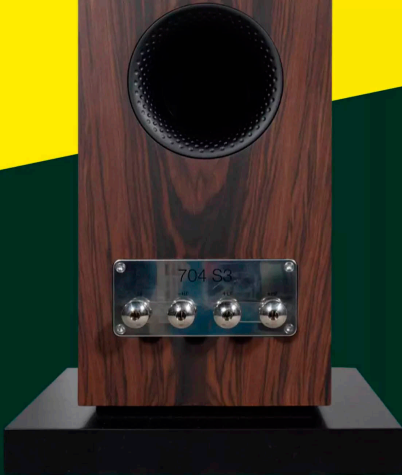
Die 704 S3 erlauben uns A&B-Wiring. Dafür muss die messingfarbene Brücke sachkundig entfernt werden. Der optimierte Bassreflex für noch mehr Low-End sitzt darüber

cken. Zum Beispiel ein paar ansprechende Lautsprecherklemmen. Die vom hauseigenen Premium-Segment inspirierten Kernelemente sorgen für einen sicheren elektrischen Kontakt und eignen sich zudem hervorragend für den Betrieb mit einem Speaker-Kabel mit Kabelschuhen. Die Frequenzweichen arbeiten mit Bypass-Kondensatoren aus dem Hause Mundorf sowie