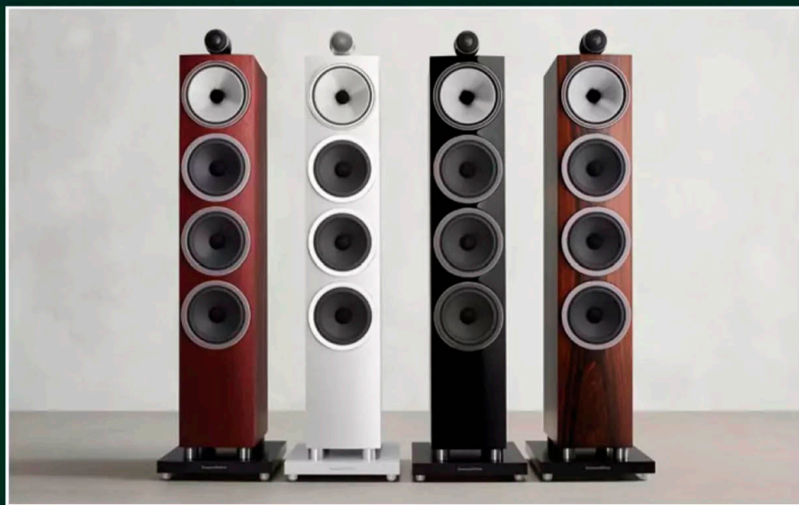
Blick auf die 702 S3, das größte Lautsprechermodell der neuen 700er Serie. Die 704 S3 ist der schmalste der drei 700er Standmodelle und kommt ohne Tweeter-On-Top. Der Performance tut dies kein Abbruch, wie unser Klangtest beweist

Unser Setup besteht dieses Mal in der Hauptsache aus einem Rotel RA-1592 Verstärker, einem TIDAL-Account und unserer Couch. Das verlustfreie Zuspielden besorgen wir mit dem Cam-