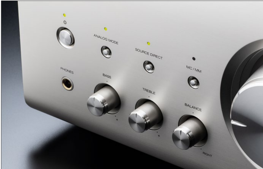
Wie es sich für einen High Ender gehört, ist der Ausgang des Kopfhörerverstärkers im 6,3-mm-Format ausgeführt. Der Benutzerfreundlichkeit wegen an der Frontseite leicht zugänglich

3000NE entweder den Betrieb eines Lautsprecherpaares im Bi-Wiring oder eben die Ansteuerung zweier dezidiert Stereo-Paare. Wir entscheiden uns für Letzteres und bringen mit zwei Regallautsprechern Gold 50 6G von Monitor Audio und zwei kompakten Contour 20 Black Edition von Dynaudio auch zwei Modelle ins Spiel, deren Testberichte Sie weiter vorn im Heft studieren können. Des Weiteren schließen wir über eine Lichtleiter-Verbindung ein TV-Gerät an den Amp, wobei wir allerdings lediglich probieren wollen, ob die versprochene Aufweck-Option funktioniert. Spoiler: Ja, es geht. Der Stand-By-Modus des PMA-3000NE ist durchaus nicht zu vernachlässigen, denn bei voller Auslastung schluckt der Amp gerne mal bis zu 400 Watt. Ganz kompromisslos.