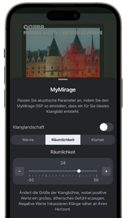
Streaming, Steuerung und DSP-Anpassung (hier) laufen bei Marantz stets über HEOS.

Nur müssen wir aber noch mal auf den Preis des All-in-One zu sprechen kommen. Denn für knapp unter 4.000 € ließe sich schon eine mehr als ordentliche HiFi-Anlage zusammenstellen. Etwa ein leistungsstarker Streaming-Verstärker (wie sie Marantz ja ebenfalls anbietet) und ein Paar Standboxen zeigen nämlich den inhärenten Nachteil von Lautsprecher-Komplettsystemen wie dem Horizon auf: Aus einem einzelnen kompakten Gehäuse kann keine Stereo-Bühne kommen, die mit einem solchen Paar Lautsprechern mithält.