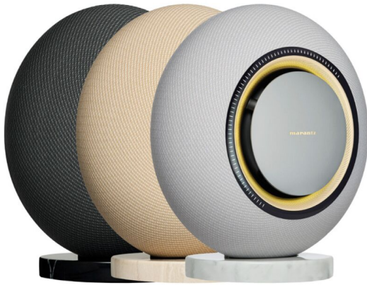
Beide Lautsprecher der Horizon-Serie gibt es in drei verschiedenen Finishes.

Auch für verschiedene Platzierungen bietet Marantz Klang-Presets, die den Bass beeinflussen – falls möglich, empfehlen wir hier die freie Aufstellung mit dem entsprechenden Setting. Bei kabelgebundenen Eingängen gibt es schließlich einen für den TV praktischen Stimmverstärker sowie einen „Nacht“-Modus.