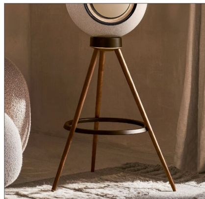
Für den Horizon bietet Marantz optional einen passenden Holzständer an.

Der klangliche Vergleich zu den meisten Geräten der Kategorie Smartspeaker startet eindeutig, der Horizon spielt erwartbar auf einem komplett anderen Level. Er klingt detailliert, ausgeglichen und schafft es dabei, für seine Größe beachtliche Lautstärken und Tieftöne zu liefern. „What Else