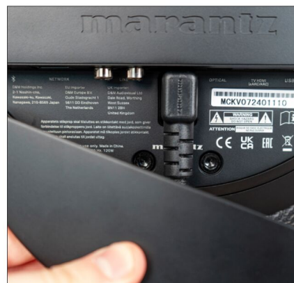
Strom- und Anschlusskabel werden von einer magnetisch haftenden Blende versteckt.