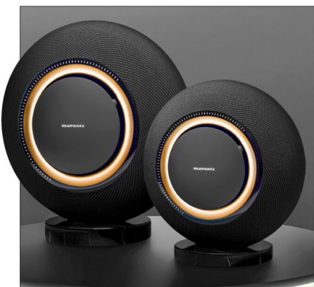
Bei gleichem Look ist der Grand Horizon (l.) größer, schwerer und hat mehr Lautsprechertreiber.

Schlussendlich lässt sich der DSP aber auch umgehen, was Marantz konkret den „Sound Master“-Modus nennt – denn die klangliche Abstimmung im „Neutral“-Modus unterliegt wie alles der Firma dem „Sound Master“ von Marantz. Dass dessen Einschätzung nicht ganz danebenliegt, bewies etwa die zu gleicher Zeit vorgestellte, begeisternde (und ebenfalls nicht gerade billige) CD-Player-Amp-Kombi der 10er-Serie (STEREO 1/2025). Aus dem Stand gefällt uns durchaus dieser neutrale Modus meist besser als der „Umweg“ über die DSP-Klanganpassungen, wobei diese immer für ein bisschen Personalisierung gut sind.