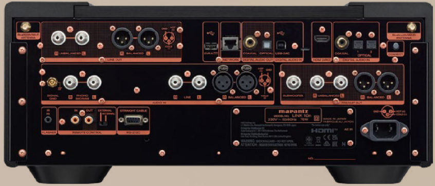
Neben XLR wartet der LINK 10n sogar mit je einem analogen Cinch-Eingang sowie einer integrierten Phono-Vorstufe auf. Selbst der Anschluss eines Subwoofers ist am Marantz möglich

separiert, sodass sich ein faszinierend luftiges, dreidimensionales Klangbild ergibt. Mit „La Bambola“ von Patty Pravo betritt der LINK 10n schließlich die Bühne eines glanzvollen, italienischen 60s-Pop-Sounds. Die ikonische Stimme von Pravo besitzt jenen leicht rauchigen Charme, den der Netzwerkplayer mit feiner Nuancierung und perfekter Kontrolle abbildet. Der satte Basslauf gibt dem Song sein pulsierendes Fundament, das durch ein volles, organisches Gitarrenspiel ergänzt wird. Beeindruckend ist hier, wie differenziert der Marantz LINK 10n die Begleitung in Szene setzt: Streicher und Backing-Vocals erscheinen harmonisch verwoben, aber stets greifbar. Der LINK 10n verleiht dem Song jene Mischung aus Leichtigkeit und Nachdruck, die ihn zeitlos macht. Ob dynamischer Jazz, sphärischer Art-Pop oder stilvoller Vintage-Sound – der Marantz LINK 10n zeigt sich in allen Genres als audiophiler Überflieger. Seine Fähigkeit, Details mit chirurgischer Präzision herauszuarbeiten, ohne die Musikalität zu opfern, macht ihn zu einem absoluten Highlight im Bereich der Netzwerkplayer. So lässt