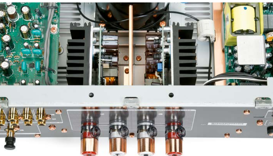
Die Class-D-Endstufen von Hypex sitzen praktisch verlustfrei an den Lautsprecherausgängen.

Fluss und musikalischer Cremigkeit, die bei dieser Marke stets von einer inneren Harmonie begleitet wird. Letzteres gilt buchstäblich für jedes Marantz-Produkt, das ich kenne, unabhängig von der Dekade, aus der es stammt, und es führt dazu, dass man auch diesem Amp lange Zeit zuhören kann, ohne dass es jemals nervig würde. Feingeist, Farbe, Details, eine weiträumige, facettenreiche Bühne mit Swing und zudem saftigen Druck bis in die untersten Lagen liefert dieser Amp freilich reichlich on top, sodass es auch nie eine Sekunde langweilig werden könnte. Beim obligatorischen „TriCycle“ von der STEREO Hörtest-CD III hält einen nichts mehr ruhig auf dem Sitz, auch wenn die heftigen Impulse den Amp selbst nicht im Ansatz aus der Ruhe bringen. Ob die Facetten der Reibeisenstimme Joe Cockers oder aber des völlig anders gelagerten, glockenklaren Timbres von Cara Dillon, der Marantz arbeitet filigranste Details und selbst Hintergrundtexturen sauber heraus und stellt die Protagonisten plastisch, gestaffelt und wie festgenagelt zwischen die Lautsprecher. Der Auftritt ist entspannt und sehr natürlich, fernab jeder Anstrengung oder Nervosität, aber auch bar jeglicher Hyperaktivität. Künstliche Auflösung durch Ausdünnung – Fehlanzeige. Dieser Amp hat Esprit, Eleganz und Kraft, was ihn definitiv zum echten Marantz macht. Ein absolut toller, zeitgemäßer Verstärker mit unverkennbarer Marantz-DNA! Der Generationswechsel ist geglückt – aber sowas von. ■