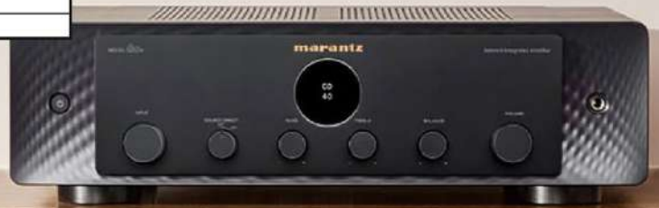
Marantz Model 60n