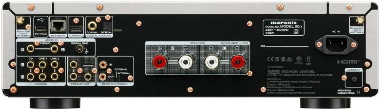
Die Anschlüsse des Model 60n sollten für die meisten Anliegen genügen. Nutzen wir den Subwoofer-Anschluss, können wir auch im Stereo-Setup für mehr Klangvolumen sorgen

als reiner Pre-Amp genutzt werden. Zu guter Letzt noch ein Wort zum Thema Subwoofer. Beide Modelle haben einen entsprechenden Ausgang, jedoch unterscheiden sich die Tiefpassfilter. Das Model 60n hat einen festen Tiefpassfilter bei 150Hz, während der PM7000N wählbare Frequenzen in 20er-Schritten von 40 Hz bis 120 Hz bietet. Das spricht tatsächlich für den PM7000N, wobei der feste Tiefpassfilter mehr Sicherheit gerade für Subwoofer-Erstanwender bietet.